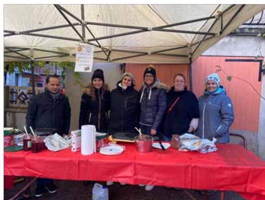
Une partie de l'équipe du Sou des Ecoles sur le stand du Marché de Noël

L'équipe du Sou s'est agrandie cette année encore, nous sommes heureux d'accueillir de nouveaux parents et donc de nouvelles idées ! L'association du Sou est avant tout un lieu de rencontres et d'échanges de personnes dévouées, volontaires et animées d'une bonne humeur. N'hésitez pas à nous rejoindre !