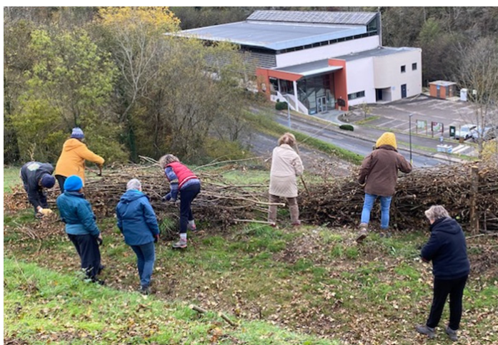
Atelier fabrication d'une haie sèche sur le sentier du vélair