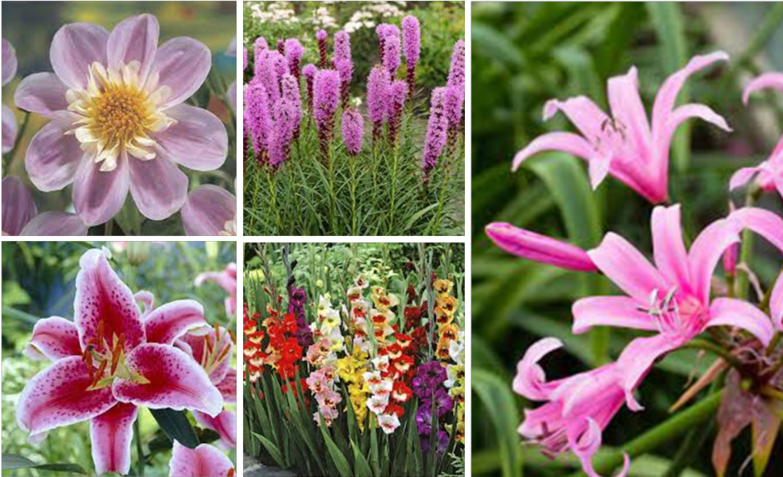
Dahlia, Lis, Liatris, Amarine, glaïeuls, etc...

Quoi de plus beau et de magique que de voir chaque année sortir de terre de majestueuses fleurs issues de bulbes qui se terraient jusque-là à quelques centimètres au-dessous du niveau du sol depuis plusieurs mois. Nous connaissons tous les bulbes de printemps les plus répandus, ceux qui annoncent admirablement l'arrivée des beaux jours (narcisses, tulipes, jacinthes etc) mais il existe aussi des bulbes à floraison estivale. Une sélection a été faite et sera implantée dès ce printemps. Parmi les critères de sélection choisis, ont été cochés notamment la durabilité des bulbes, c'est-à-dire leur faculté à se naturaliser, à se multiplier naturellement en terre, gage d'une présence pendant de nombreuses années.