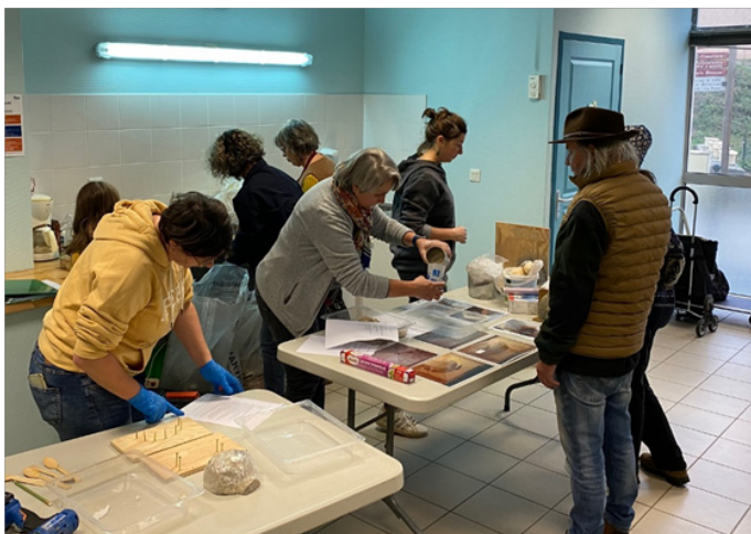
Atelier de fabrication de nichoirs à hirondelle animé par la LPO