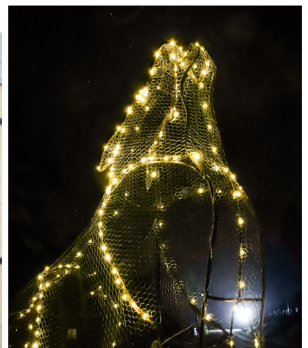
La famille biche, le loup et l'aigle